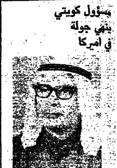
مسؤول كويتي يفتي جولة في امريكا

وقال ان الهيئة قد قامت في هذا الصدد ، بالاتصال بوزارة موانئ قناة السويس ، واليابان ، وفرنسا ، والترويج بحيث يتصل كل منها بمرسة معينة حتى يمكن القرفة بين كافة وجهات القفر . كما قامت في نفس الوقت باستصلاح ميناءات جديدة في مدينتي شبراخيت والقاهرة ، وفتحها لخدمة الملاحة الدولية .